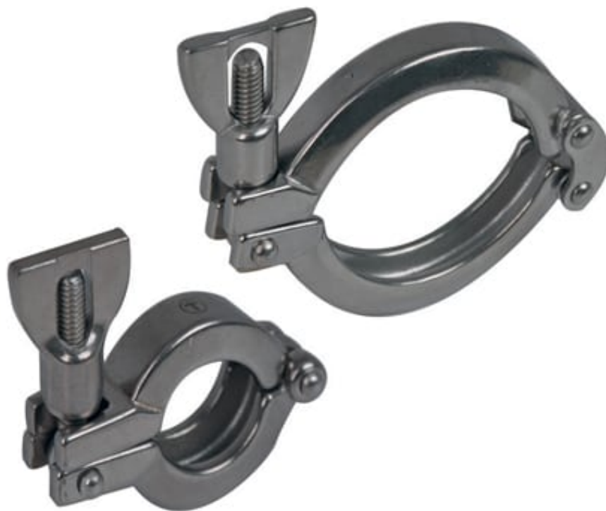
Morsetto CLAMP STANDARD Materiale: AISI 304 (1.4301)