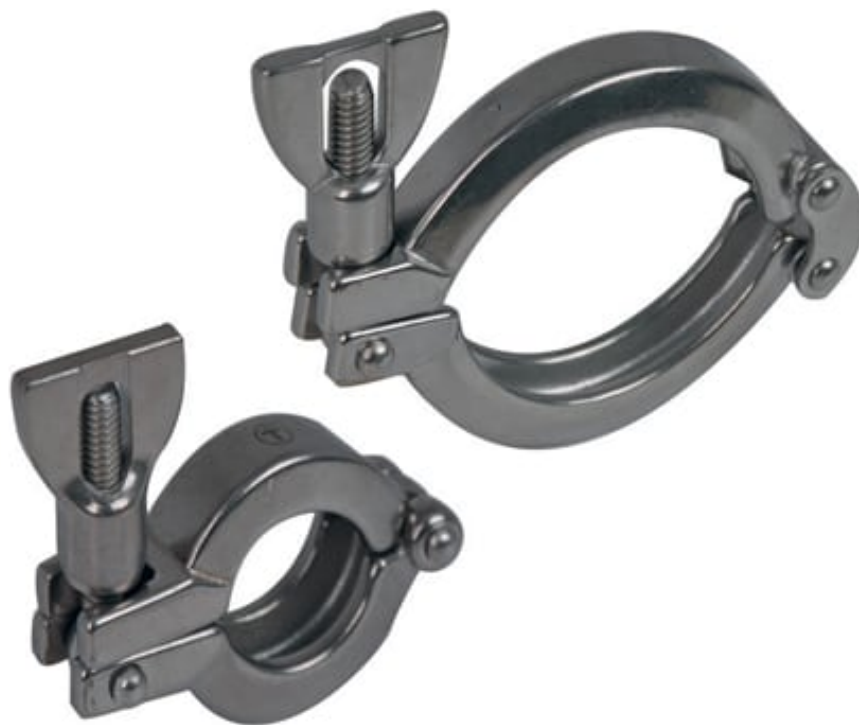
Abrazadera CLAMP ESTÁNDAR Material: AISI 304 (1.4301)