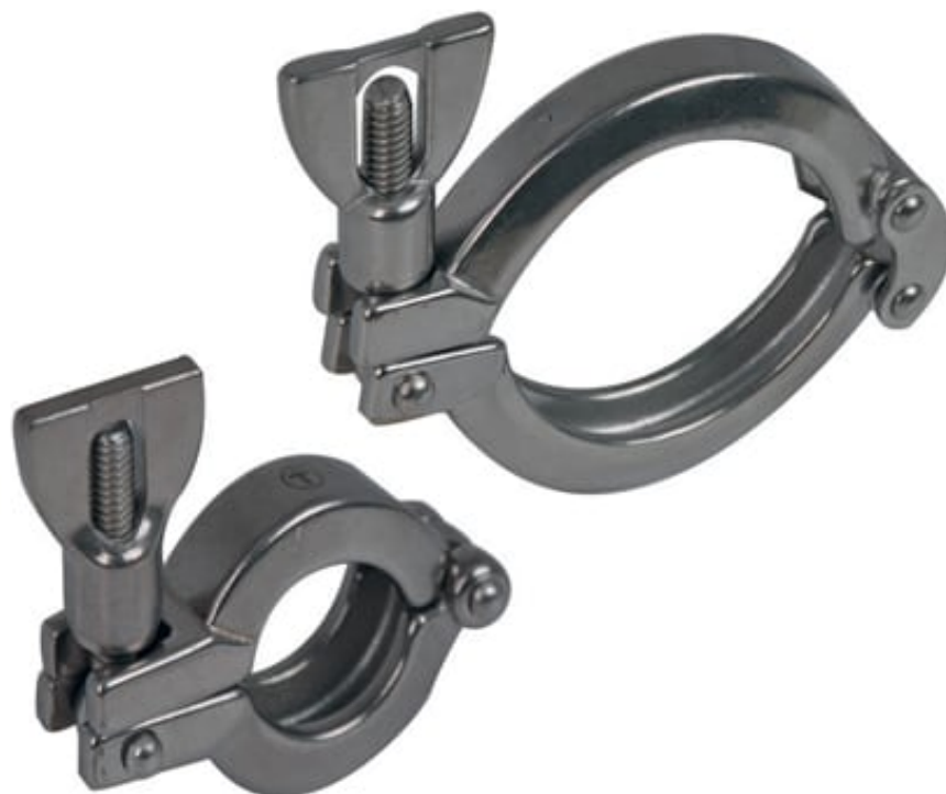
STANDARD CLAMP Climp Material: AISI 304 (1.4301)