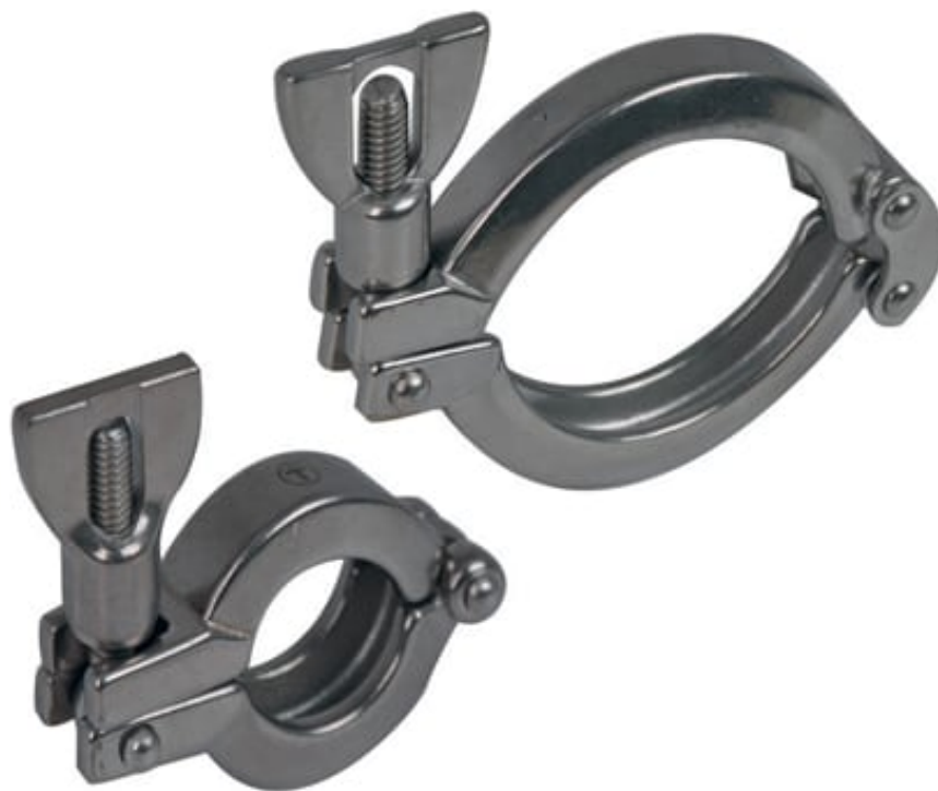
STANDARD CLAMP Klemme Material: AISI 304 (1.4301)